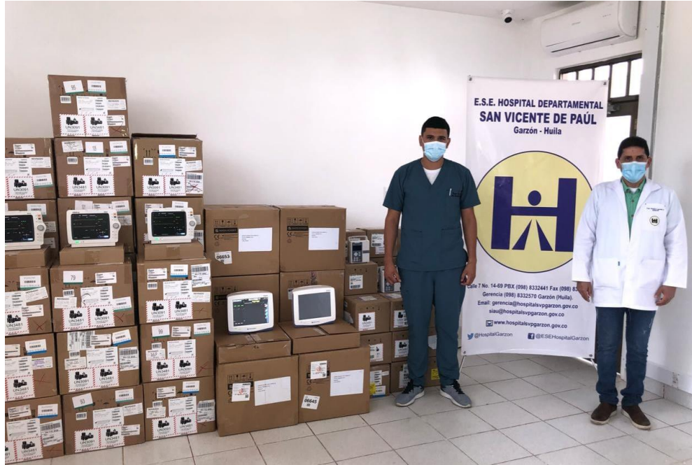
Ilustración 10 Entrega de monitores y bombas por parte del gobierno Departamental