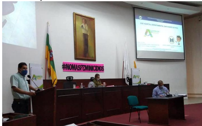
Ilustración 3 Debate de control político sobre Sindicatos de Gremio del sector Salud en el Huila