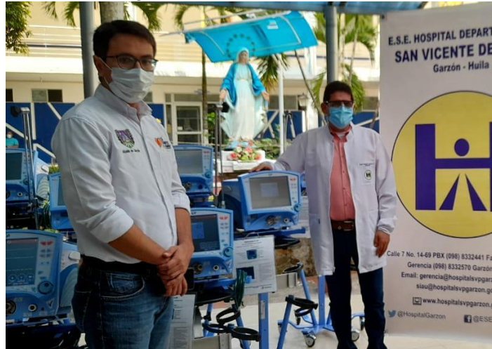
Ilustración 12 Entrega de 15 ventiladores a través del Gobierno Nacional