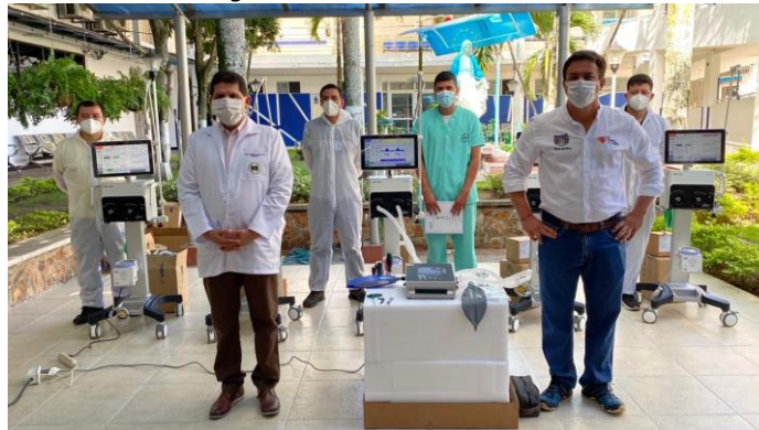
Ilustración 5 Entrega de ventiladores Gobierno Nacional