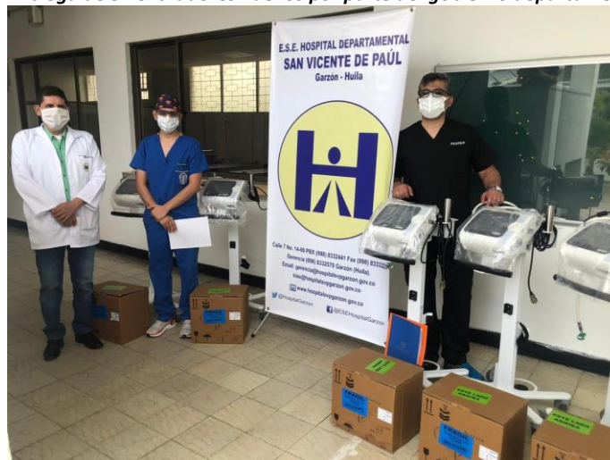
Ilustración 9 Entrega de 5 ventiladores nuevos por parte del gobierno departamental