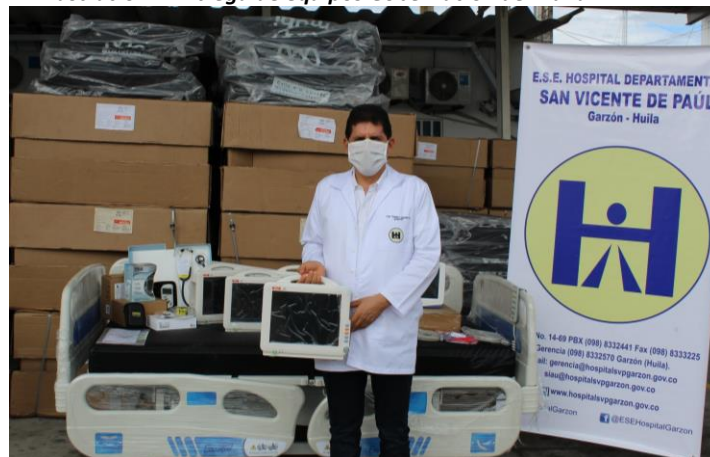
Ilustración 7 Entrega de equipos Gobernación del Huila