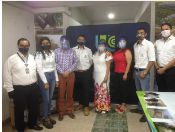
Ilustración 2 Donación Universidad Cooperativa de Colombia-Sede Neiva